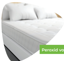
Peroxid vodíku 3%

Otestujte jedlou sodu na kousku koberce, prověřte zda nedochází ke změně barvy. Před použitím jedlé sody, koberec vysajte, abyste odstranili nečistoty. Rovnoměrně posypte jedlou sodu na koberec nebo čalounění, nechte ji působit po dobu 30 minut, klidně i déle, ideálně přes noc. A následně ji odstraňte pomocí vysavače.