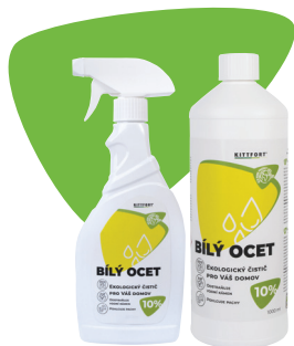
Balení: 500 ml, 1 l