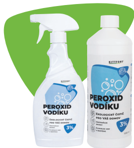
Balení: 500 ml, 1 l

Oblíbený a vyhledávaný čisticí prostředek pro všechny, kteří preferují šetrné alternativy k běžným chemickým prostředkům. Bílý ocet je koncentrovanější než běžný potravinářský ocet, neobsahuje karamel, je transparentní a jeho aroma je jemnější a při čištění povrchů nezanechává viditelné stopy. Díky těmto vlastnostem je vhodný pro úklid domácnosti. Dokonale odstraňuje vodní kámen, likviduje pachy. Produkt není určen pro potravinářské účely a k přímé spotřebě.