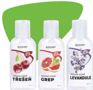
Balení: 50 ml

Je oblíbeným a vyhledávaným čisticím prostředkem pro všechny, kteří preferují šetrné alternativy k běžným chemickým prostředkům. Peroxid vodíku 3% je vhodný pro efektivní úklid, odstranění skvrn a čištění různých ploch ve Vaší domácnosti. V kombinaci s jedlou sodou, kyselinou citronovou a bílým octem lze připravit další čisticí prostředky pro Vaši domácnost.